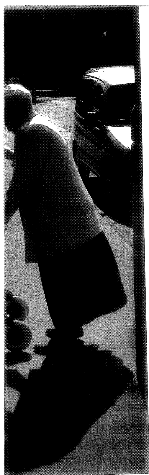
AGEN EN LOONBELASTING MOET BETALEN,

zorgorganisatie. Neem bijvoorbeeld terminale thuiszorg. Een vaste kracht kun je niet een periode van drie dagen non-stop bij een klant plaatsen. Maar voor een zzp'er is dat een fijne klus." Volgens de bestuurder zijn de cao's in de thuiszorg behoorlijk strikt. Hierdoor zijn juist kwetsbare klanten die ook buiten kantooruren zorg nodig hebben de dupe. "Volgens de thuiszorg-cao mag een medewerker geen gebroken diensten draaien. Dat is problematisch als je als traditionele zorginstelling zorg op maat wilt leveren. Vaste mensen werken vaak vaste periodes. Het wordt daarom