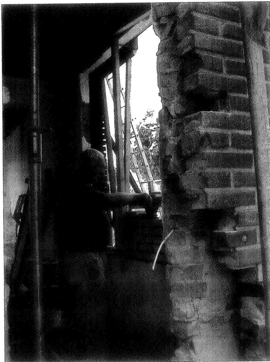
OF EN WANNEER VERPLEEGKUNDIGEN IN DE AWBZ KUNNEN GAAN WERKEN ZOALS BOUWVAKKERS IN DE BOUW, IS NOG AFWACHTEN.

grotendeels met zzp'ers werken. "Wat betreft het punt dat het convenant van 2009 zorgwetten overtreedt, mag ActiZ gelijk hebben. Maar dat hebben we zo opgelost. Al onze leden voldoen immers aan alle zorgreglementen. Zij hebben allemaal zaken als een cliëntenraad en scoren goed op kwaliteit. Hoe zouden zij anders contracten met het zorgkantoor kunnen afsluiten? Als ActiZ tegen het toetreden van kleinschalige organisaties is die met zzp'ers werken, had zij ten tijde van de AWBZ-contracteringsronde bezwaar moeten maken. En niet nadat al gecontracteerd is, gaan roepen dat het speelveld ongelijk is." Verschuren wijst erop dat de rechter in het kort geding van ActiZ niet alleen heeft bepaald dat de eindverantwoordelijkheid voor zorgkwaliteit bij de instelling ligt. "De rechter heeft ook onderstreept dat zorgkanto-